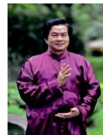
UHT System Founder Grandmaster Mantak Chia

Das praktische UHT System dient dazu, einen gesunden Körper zu pflegen, die Seele zu entwickeln und den Geist zu erhöhen. Hauptzweige und Kernformeln des UHTS beinhalten Meditation, Qi Qong, Übungen zur Heilenden Liebe sowie Kampfkunst und Chi Nei Tsang Massage. Beübt der Mensch die Techniken, befähigt es ihn, sein physisches, mentales, emotionales und spirituelles Potenzial harmonisch zu entwickeln, um sein eigener Heiler und Meister zu sein. Das ganzheitliche System wird auf 6 Kontinenten durch seinen Gründer Großmeister Mantak Chia und die UHT-Fakultät mit über 900 zertifizierten Lehrern unterrichtet. Durch seine gute Zugänglichkeit kommt das System und seine Techniken dem westlichen Lebensalltag sehr entgegen und erlaubt es jedem Menschen, aus eigener Entscheidung ein Leben voller Freude, Gesundheit, Liebe und Reichtum zu führen.